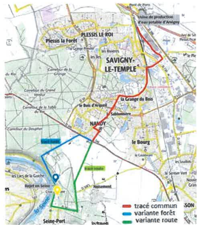
Figure 2 : Projet - opération usine et opération exutoire de rejet